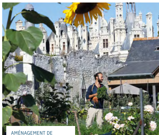
AMÉNAGEMENT DE L'EXTENSION DES JARDINS-POTAGERS DE CHAMBORD.