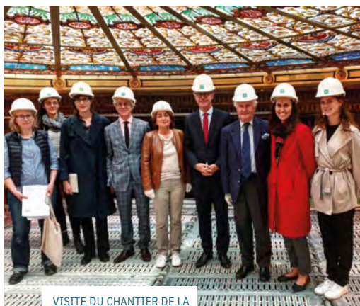
VISITE DU CHANTIER DE LA VERRIÈRE RESTAURÉE DE L'ÉGLISE SAINT-PHILIPPE-DU-ROULE, AUX CÔTÉS DE LA MAIRIE DE PARIS EN SEPTEMBRE 2020.