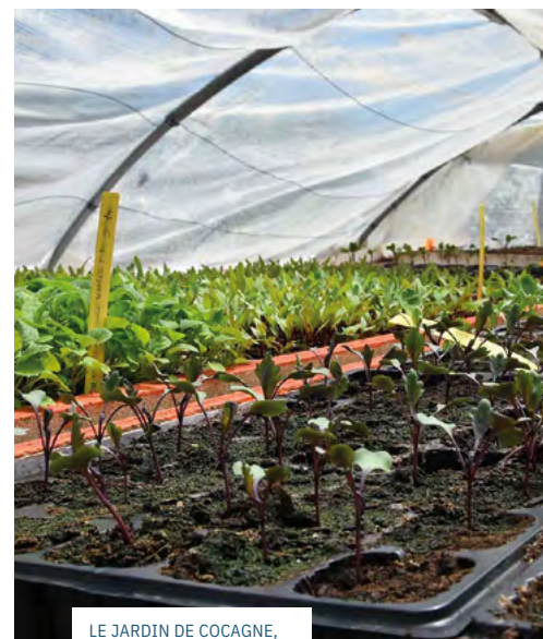
LE JARDIN DE COCAGNE, CHANTIER D'INSERTION EN MARAÎCHAGE BIOLOGIQUE, À MEAUX.

Santé, solidarité, culture, environnement... Depuis 10 ans, le Fonds de Dotation Transatlantique a soutenu plus de 500 projets. Zoom sur quelques-uns de nos bénéficiaires.