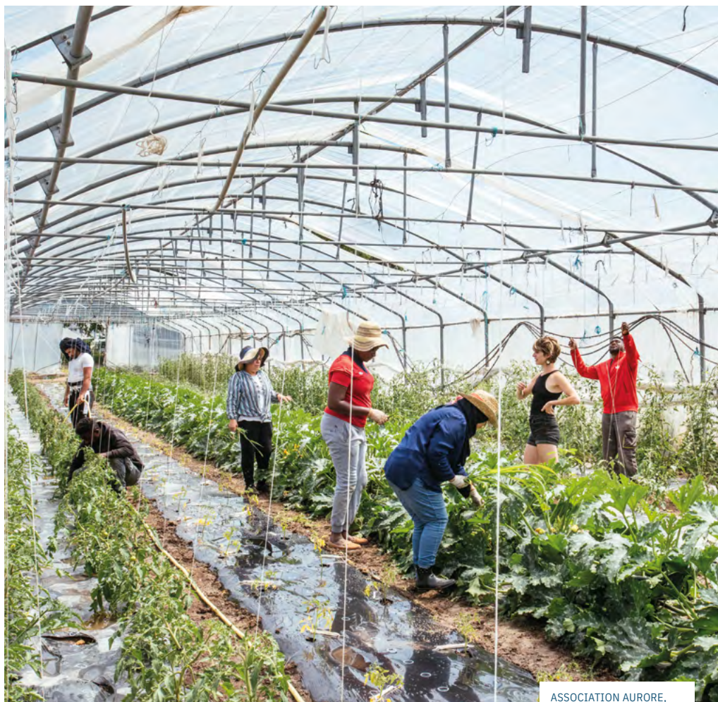
ASSOCIATION AUREO, CHANTIER D'INSERTION DES JARDINS BIOLOGIQUES DU PONT-BLANC, À SEVRAN.